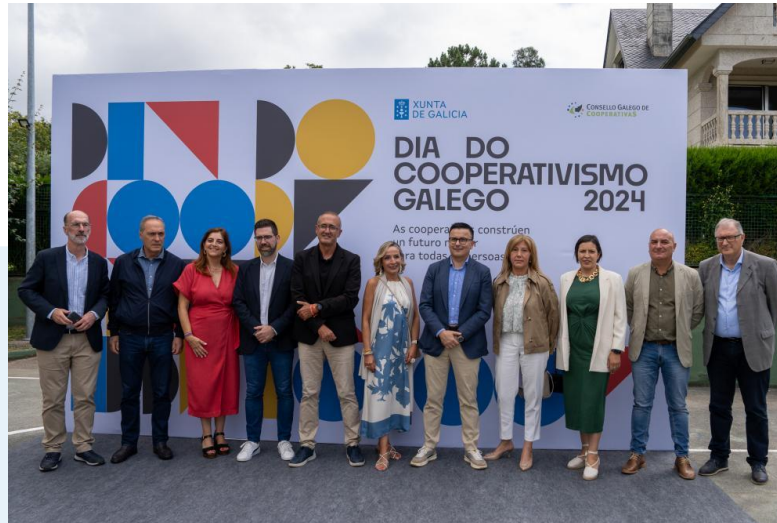
Promoción da economía social no DÍA DO COOPERATIVISMO