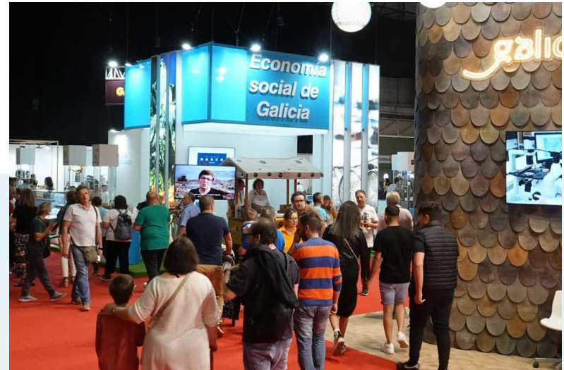
Apoio a participación en Feiras

visibilizar as cooperativas a través de experiencias reais.