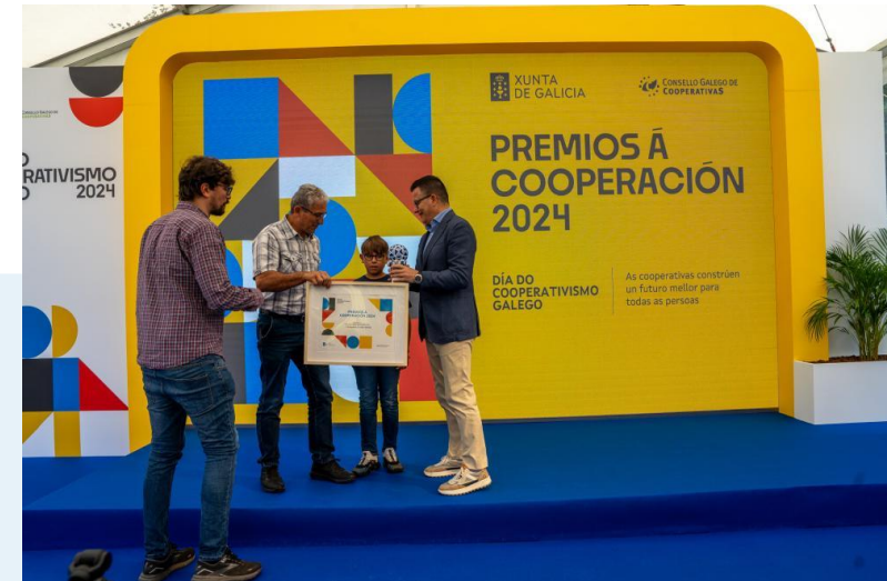
Premios á cooperación 2024